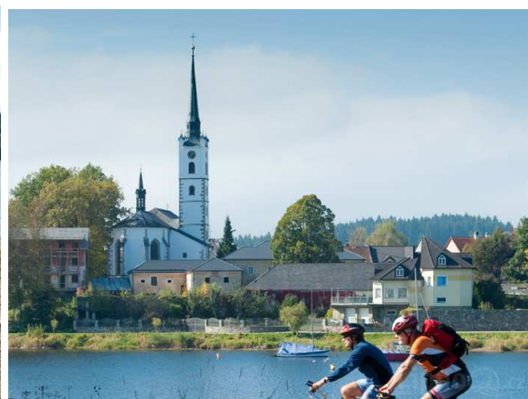
Lipnon rannoilla on hyvä pyöräillä.