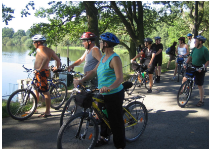
Pyöräilyä Trebonin kalalampien lomassa.