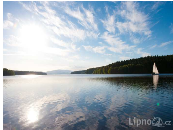
Lipno on Tshekin isoin järvi.