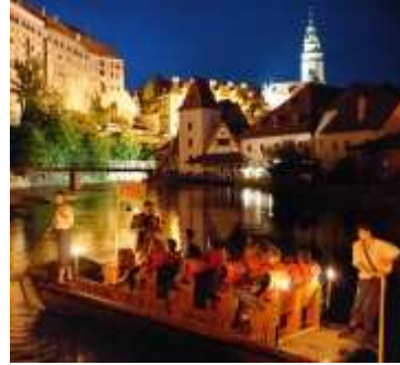
Cesky Krumlov on kaunis kaupunki päivällä ja illalla.