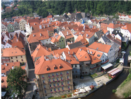
Rozmberk nad Vltavousta pyöräilemme takaisin Cesky Krumlovyyn