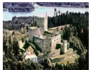
Landstejnin raunio 1200-luvulta.