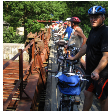
Uintia Hamrissa viileässä Malse-joessa, ja joen ylitystä pyörillä.