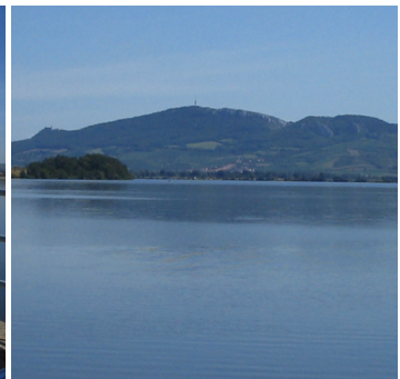
Pasohlavkyn kylässä, padoilla ja järvillä