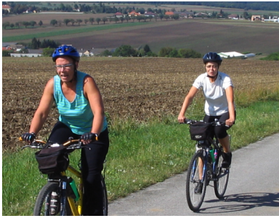
Itävaltalaisia mäkiä ja kyliä.