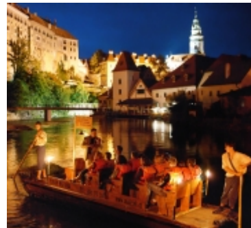
Cesky Krumlov on kaunis kaupunki päivällä ja illalla.